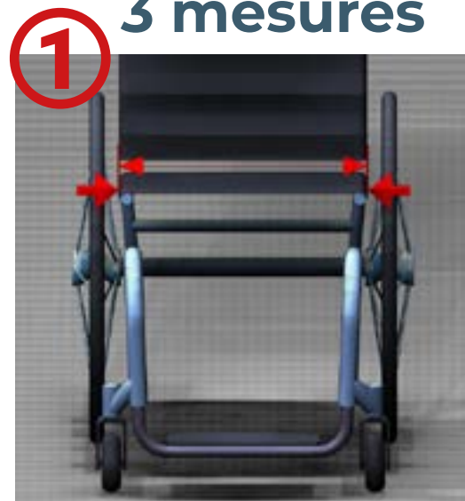
Mesure de la largeur d'assise