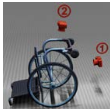
Comment prendre les photos

Vos 2 photos ressembleront aux images 1,2.