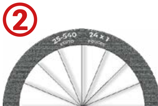
Référence complète des pneus du fauteuil.